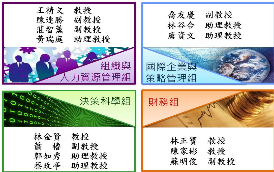
圖 2-1 本系各領域專任教師分布